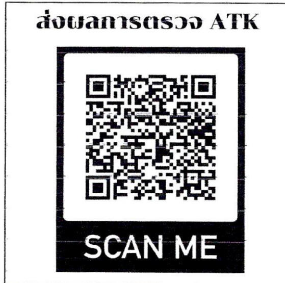
ตัวอย่าง การส่งผลการตรวจ ATK

หมายเหตุ ในกรณีที่ผลการตรวจ ATK เป็นบวก ให้ติดต่อ อาจารย์จเร ศรีมีชัย โทร.086 979 5303 ทันทีที่ทราบผลการตรวจ